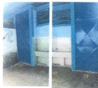
Foto 6: Se finalizó el trabajo en puertas de servicios sanitarios

Observación: Si es necesario se pueden agregar hojas adicionales y actualizar el número de hojas.