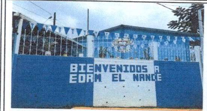
Foto1: El establecimiento tiene su pintura general