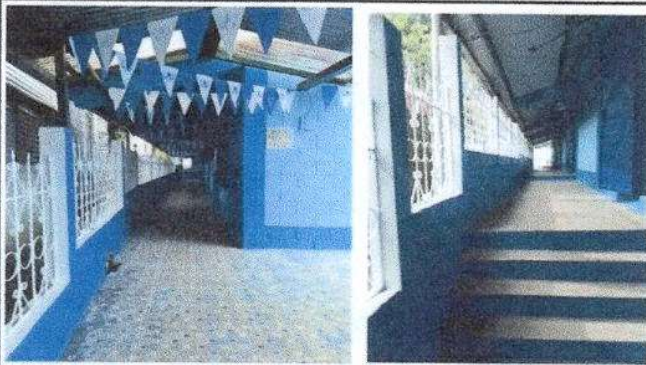
Foto 3: La pintura de muros interiores y exteriores esta finalizada