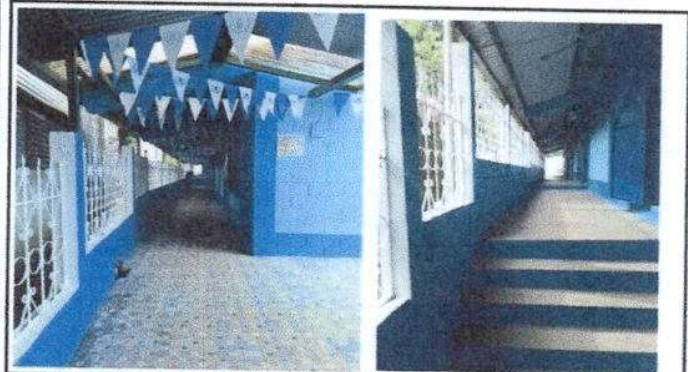
Foto 3: La pintura de muros interiores y exteriores esta finalizada