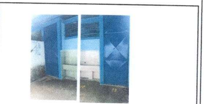
Foto 6: Se finalizó el trabajo en puertas de servicios sanitarios

Observación: Si es necesario se pueden agregar hojas adicionales y actualizar el número de hojas.